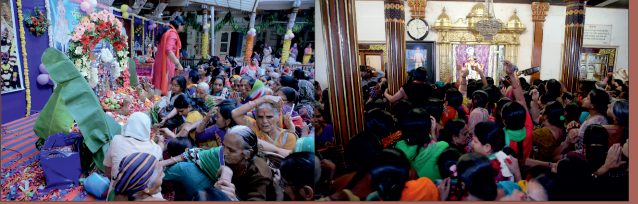
કાલુપુર મંદિરમાં ધનુર્માસ પ્રસંગે હવેલીમાં પારાયણનો લાભ લેતા અને રંગમહોલમાં શ્રી ઘનશ્યામ મહારાજના દર્શન કરતા મહિલા હરિભક્તો.