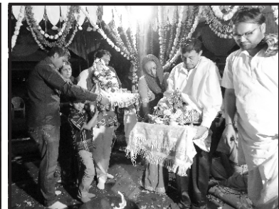
શ્રી સ્વામિનારાયણ મંદિર, ભુજમાં ઉજવાયેલ તુલસી વિવાહની તસ્વીર