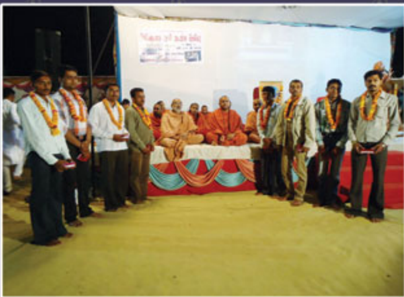
ત્રિદિનાત્મક સત્સંગ શિબિર યાત્રામાં માંડવી પુણ્યશાળી યુવાનોને મેડલ આપી સન્માનીત કરતા સંતો.