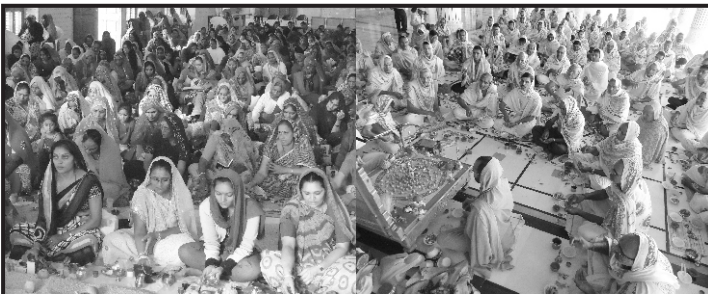
શ્રી સ્વામિનારાયણ મંદિર, ભુજમાં પ્રબોધિની એકાદશીના દિવસે બાઈઓ તથા ભાઈઓના મંદિરમાં થયેલ મહાપુજાની તસ્વીર