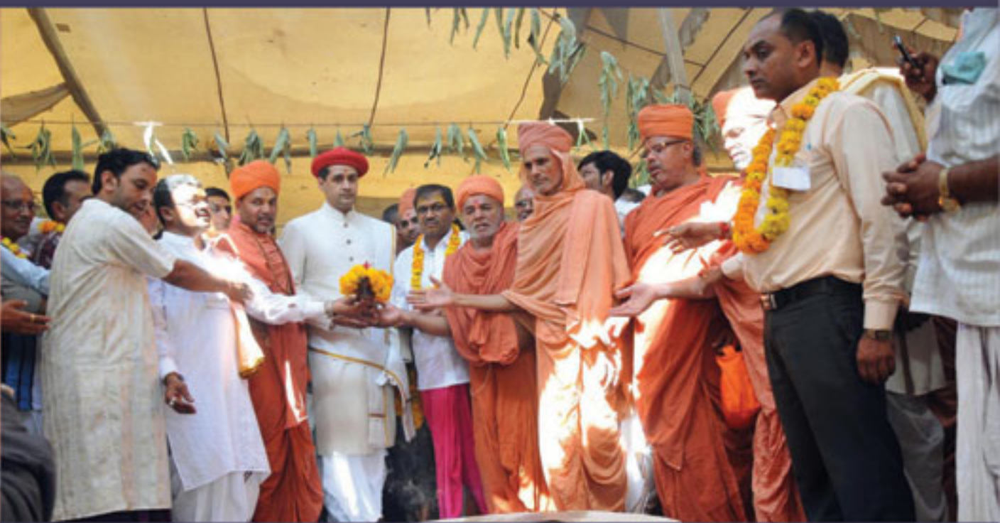
સુખપર સંસ્કૃત પાઠશાળામાં દશાબ્દી પારાયણ નિમિત્તે આચાર્ય મહારાજનું સન્માન તથા યજ્ઞાની પૂર્ણાહુતી