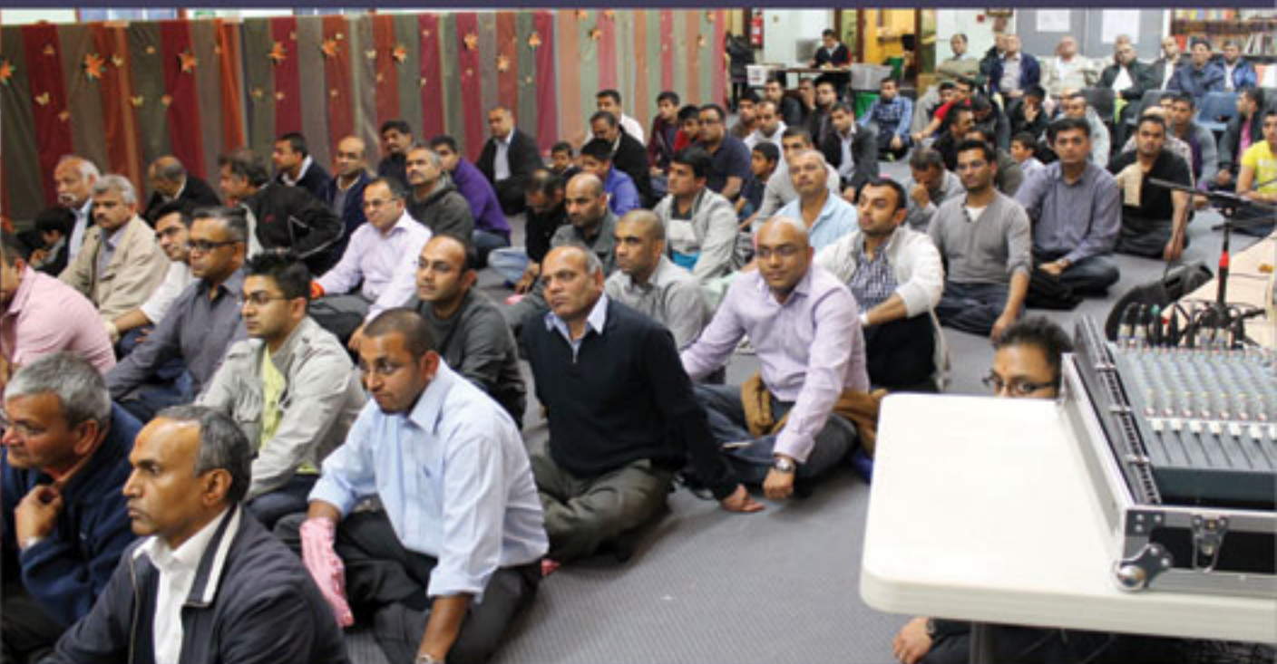
યુ.કે. બોલ્ટન મંદિરમાં પારાયણના યજ્ઞમાનશ્રી તથા કથા શ્રવણ કરતા ભક્ત સમુદાય