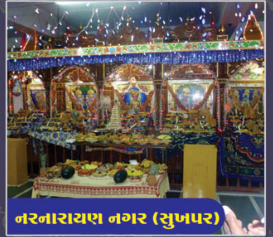
નરનારાયણ નગર (સુખપર)