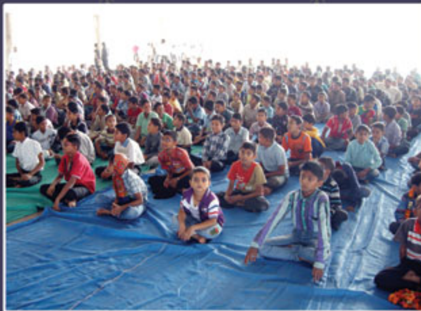
બાલ મંચમાં ભાગ લઈ રહેલા બાળકો, ભુજ.