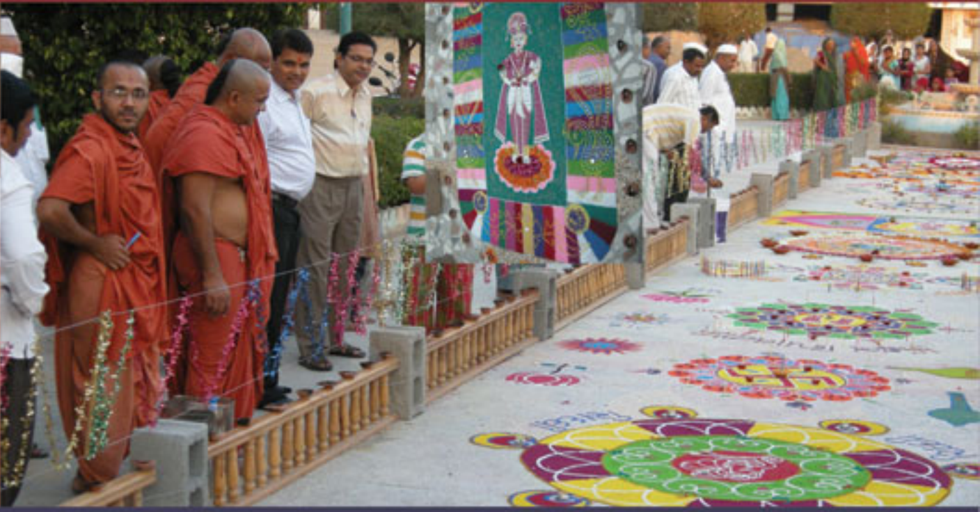
માંડવી મંદિરના નવા ઉતારનું ઉદ્ઘાટન કરતા મહંત સ્વામી સાથે સંતો તેમજ દિવાળીના દિવસે રંગોડી તથા દિપોત્સવ