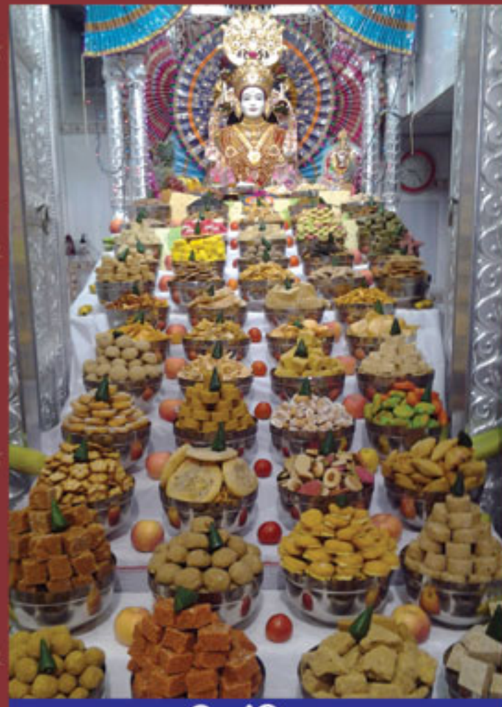
પ્રસાદી મંદિર, ભુજ